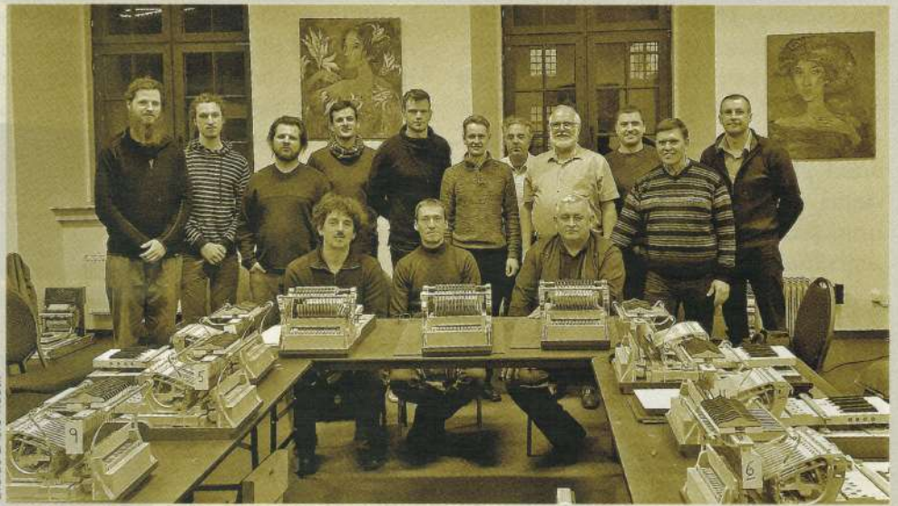
EUROPIANO egzamino dalyviai, 2018 m.